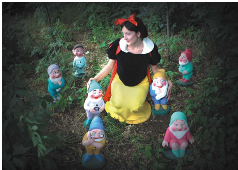
"Happy even after"