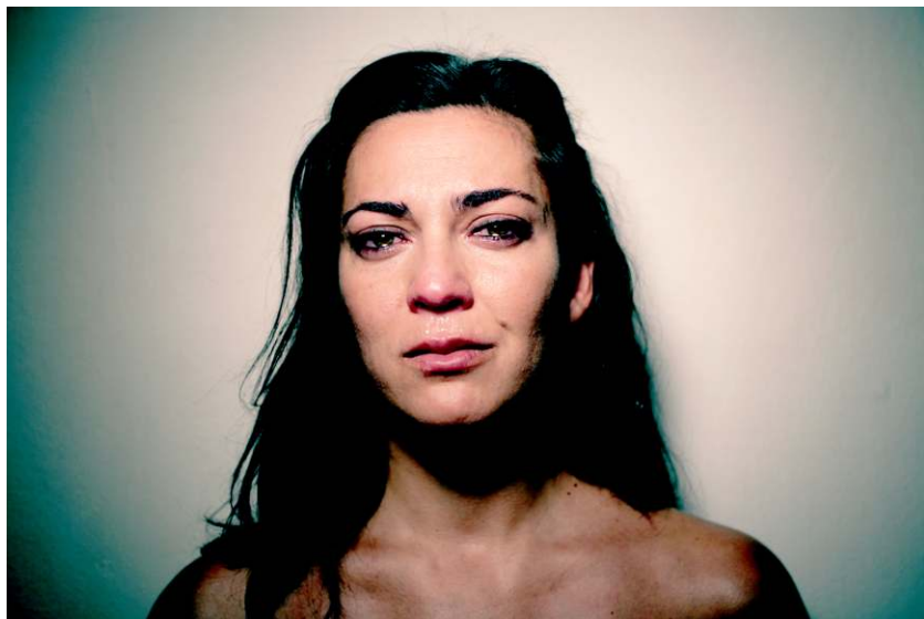
© Juanma Carrillo "To play at crying"