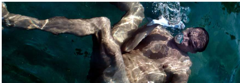
© Marius Lenewit y Rocío Rodríguez "... niland 1"